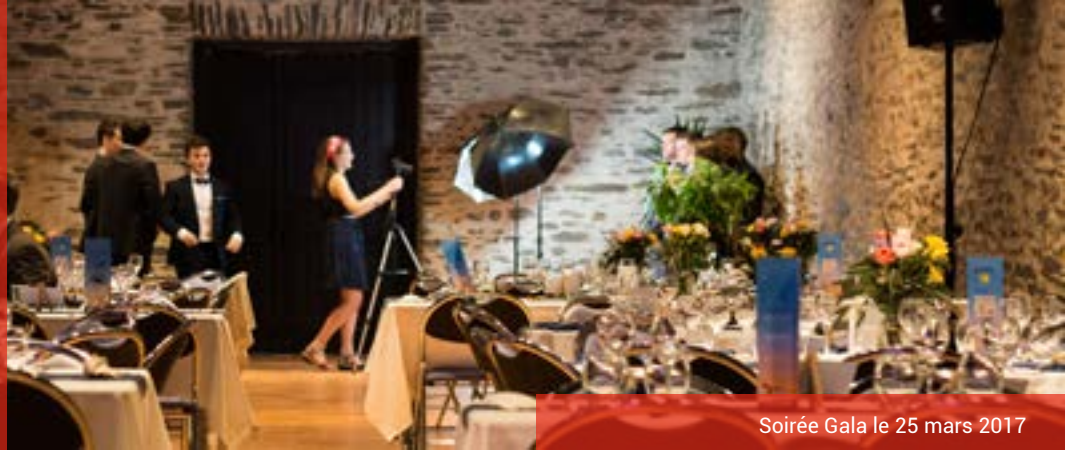
Soirée Gala le 25 mars 2017