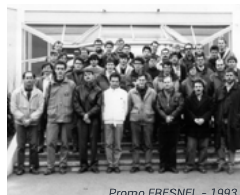
Promo FRESNEL - 1993