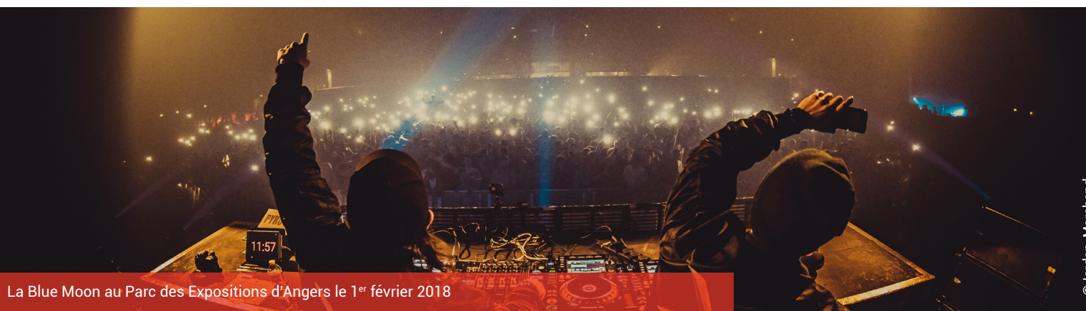
La Blue Moon au Parc des Expositions d'Angers le 1 er février 2018